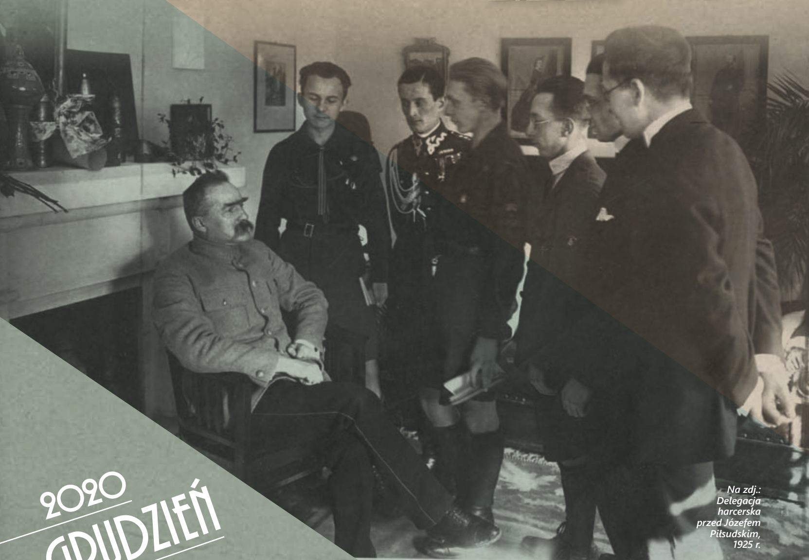
Na zdj.: Delegacja harcerska przed Józefem Piłsudskim, 1925 r.