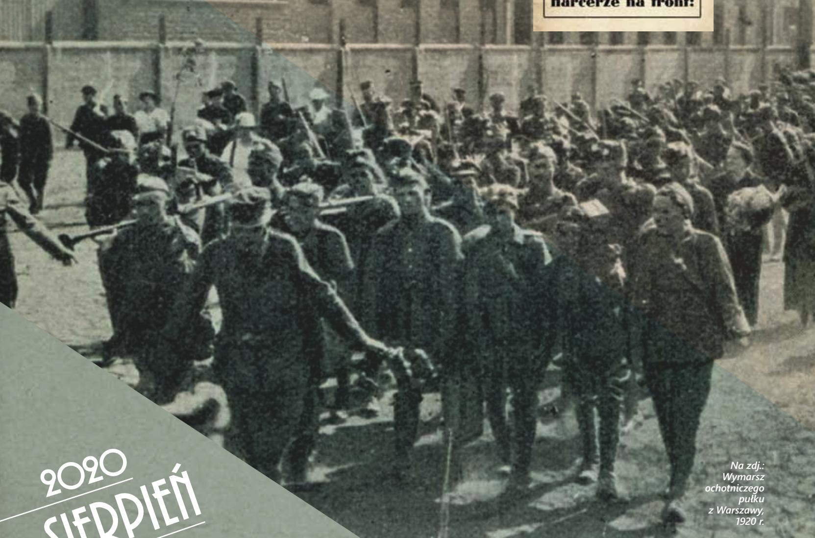
Na zdj.: Wymarsz ochotniczego pułku z Warszawy, 1920 r.