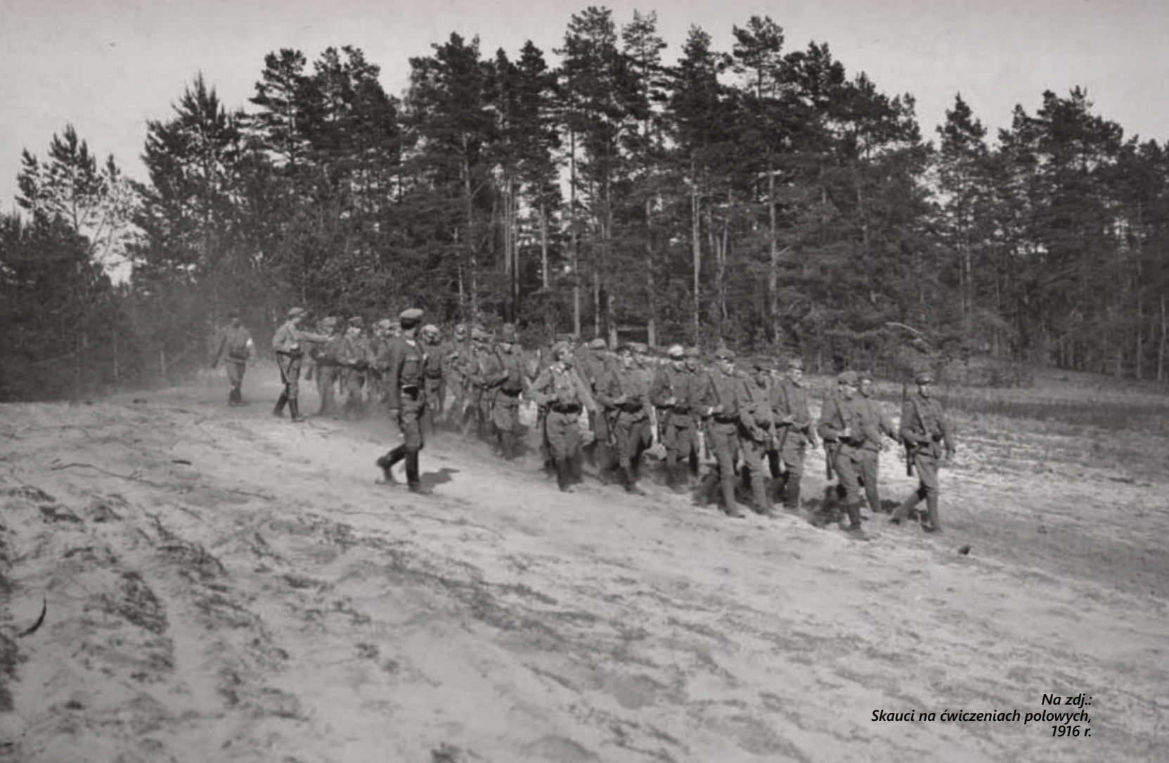
Na zdj.: Skauti na ćwiczeniach polowych, 1916 r.