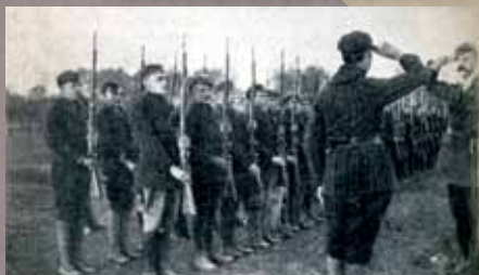
Na zdj.: Wartowniczy obóz harcerski w Pruszkowie, 1920 r.; odezwa gen. Hallera do harcerzy, 1920 r.