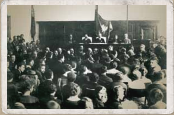
Na zdj.: Marszałek wpisujący się do harcerskiej księgi pamiątkowej, 1926 r.; I Walny Zjazd ZHP, 1920 r.