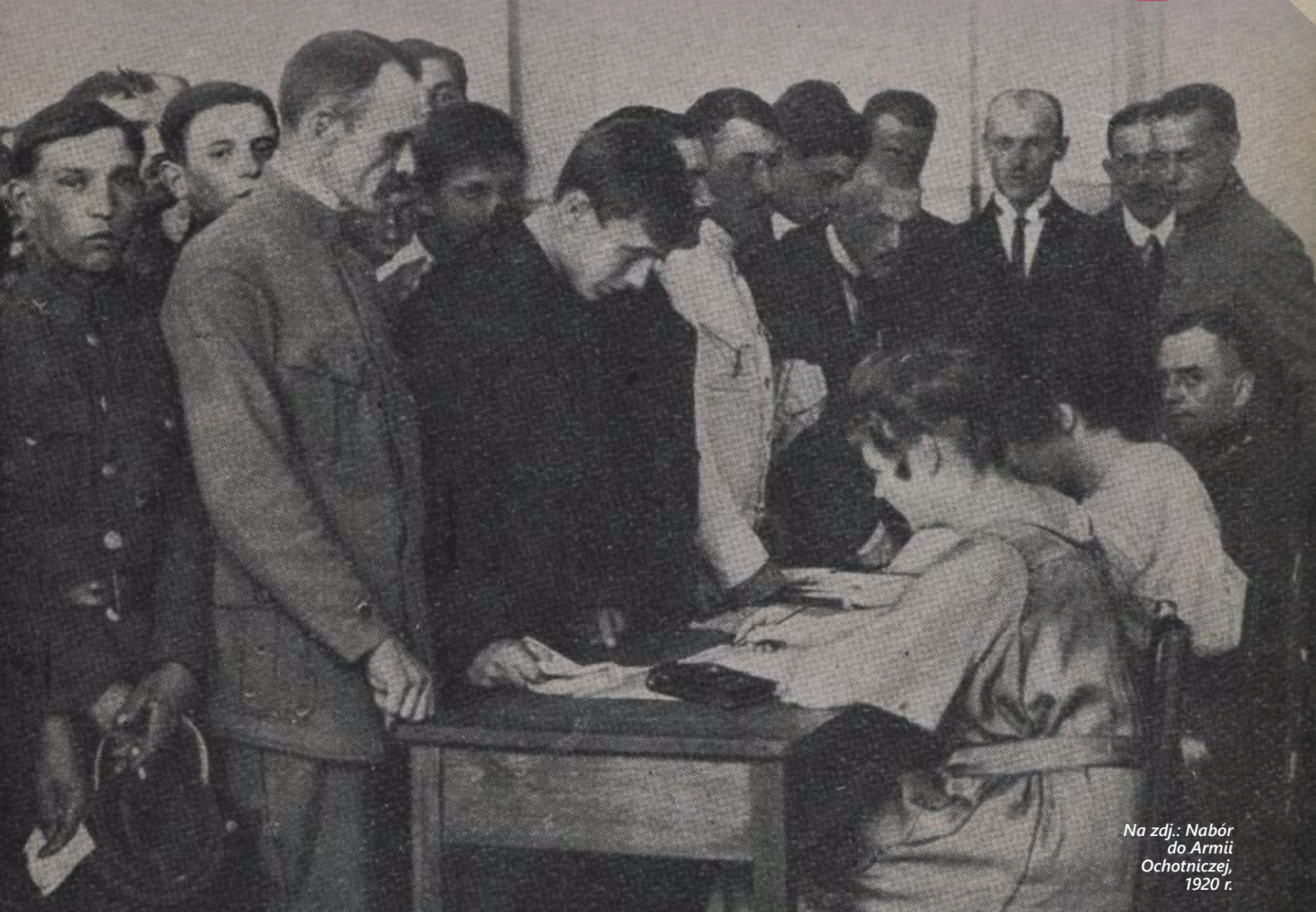
Na zdj.: Nabór do Armii Ochotniczej, 1920 r.