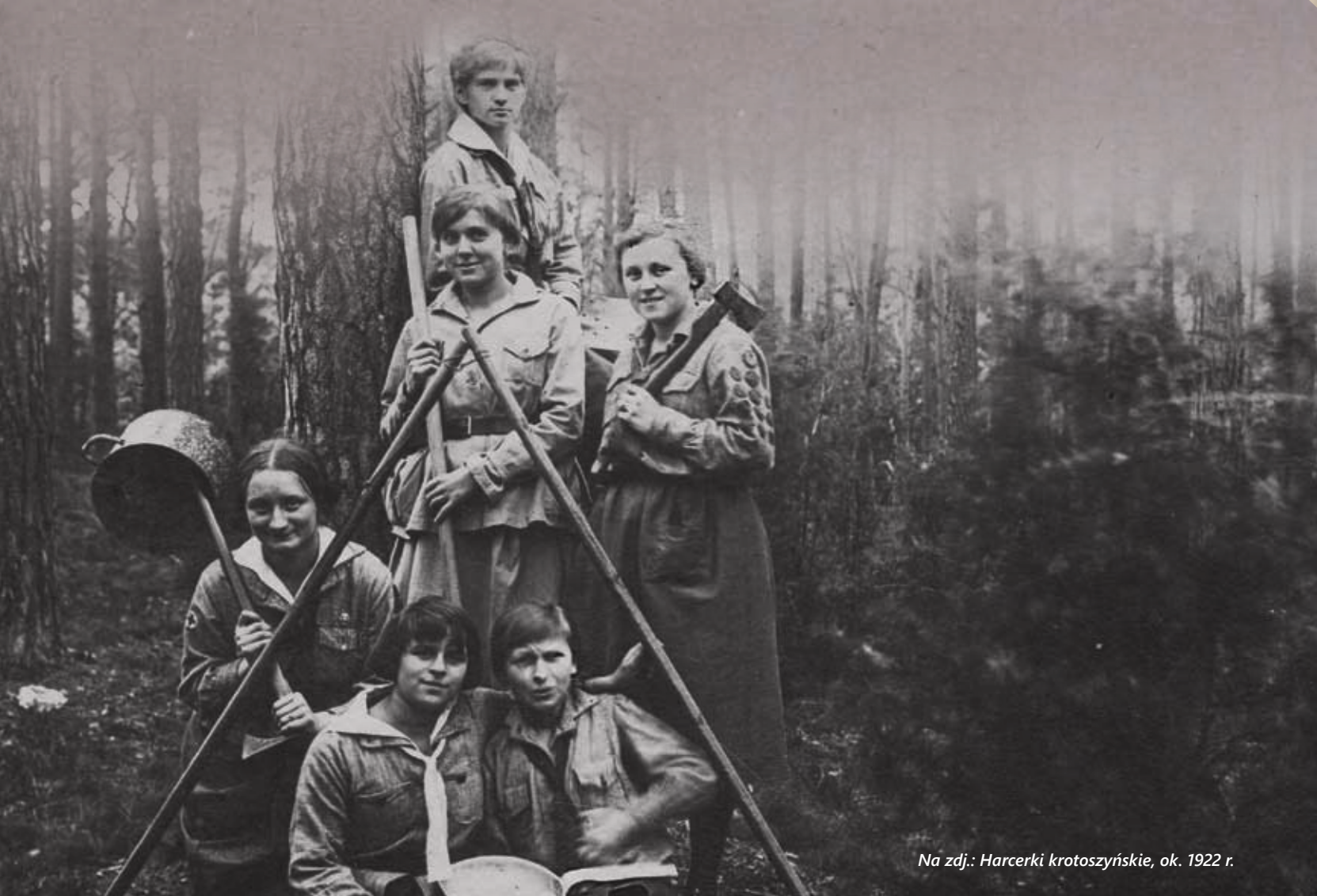
Na zdj.: Harcerki krotoszyńskie, ok. 1922 r.