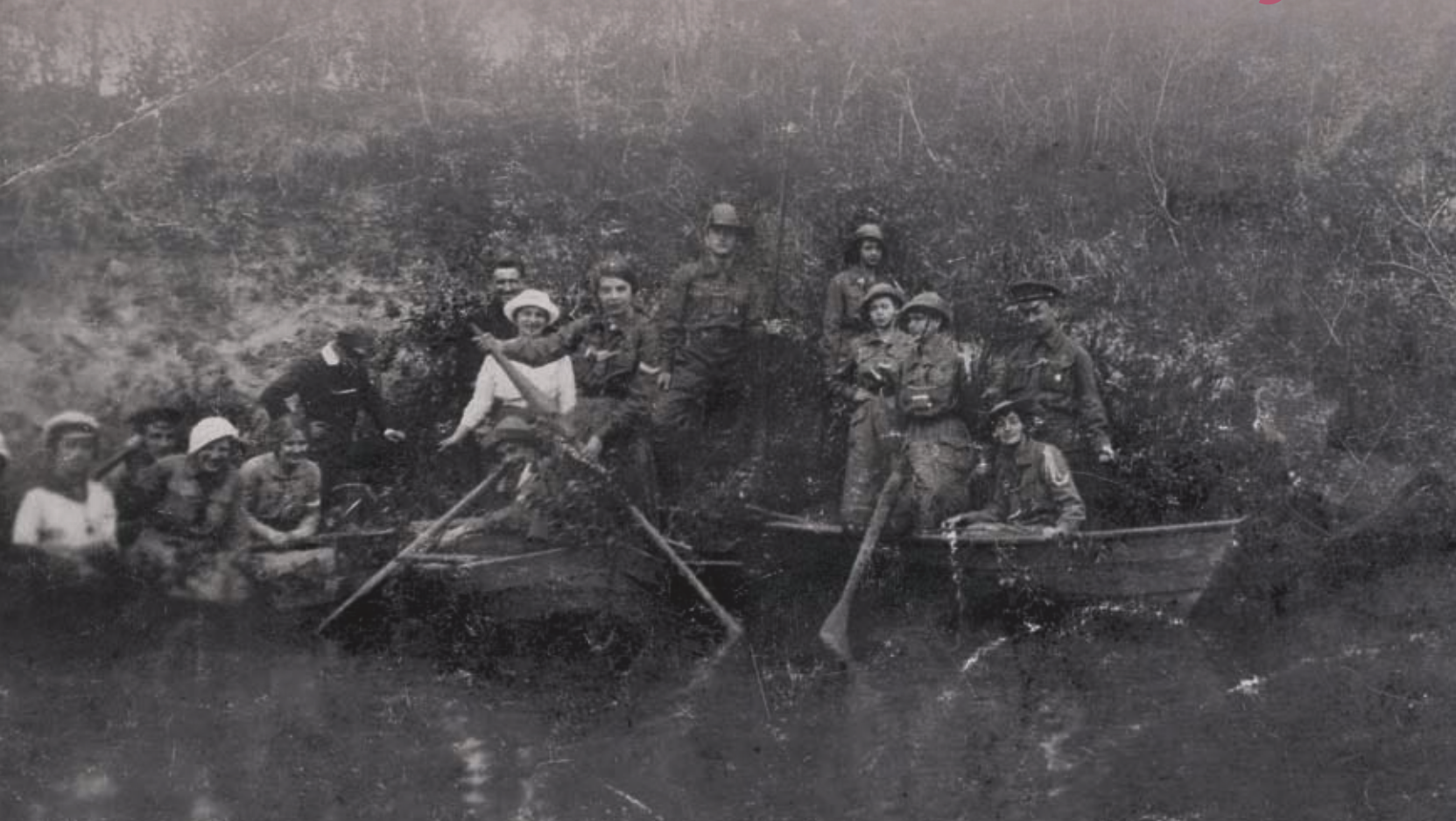
Na zdj.: Harcerze w latach 1918-1920 oraz gen. Józef Haller wśród skautów i młodzieży Gimnazjum Państwowego im. T. Kościuszki w Łucku, 1922 r.