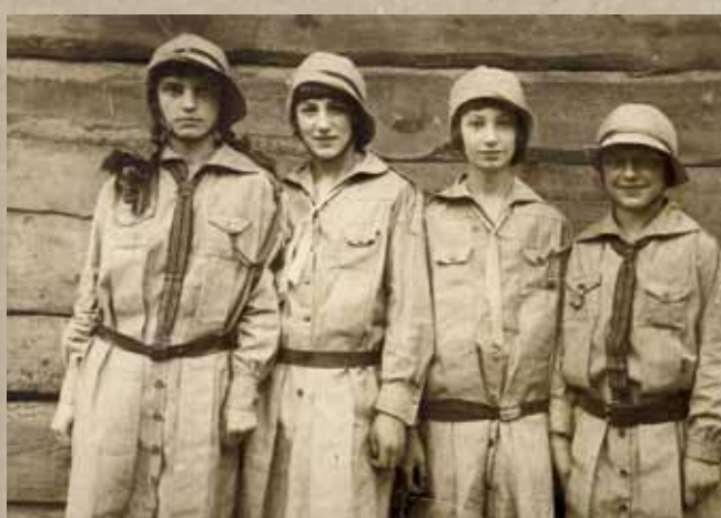
Na zdj.: Harcerki z różnych regionów ok. 1920 r.