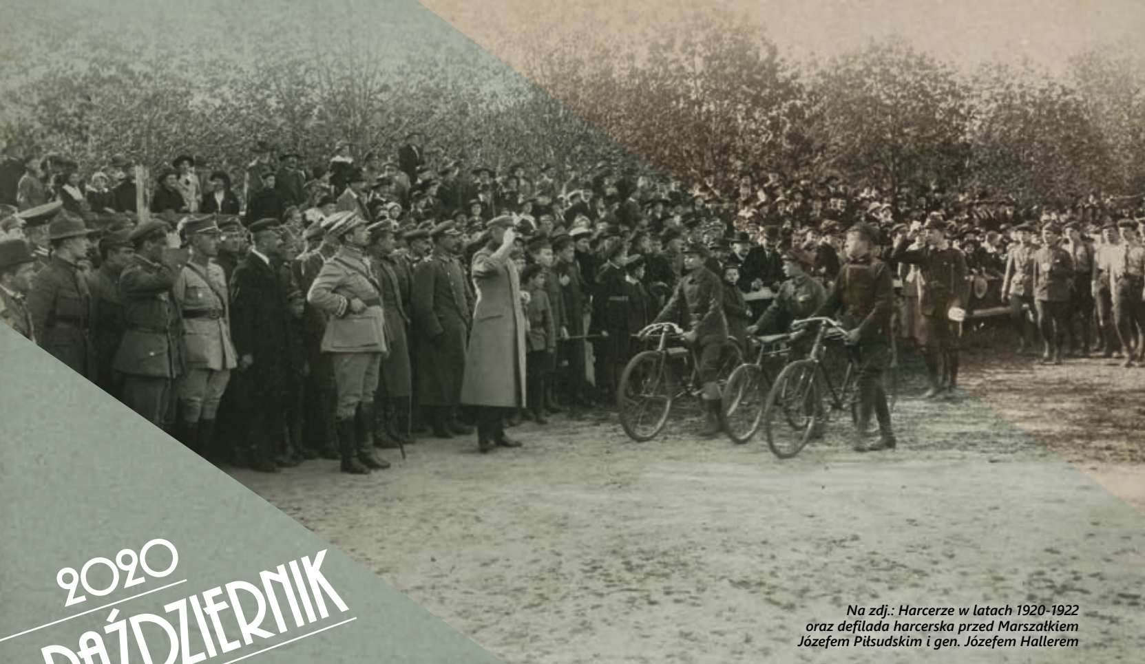
Na zdj.: Harcerze w latach 1920-1922 oraz defilada harcerska przed Marszałkiem Józefem Piłsudskim i gen. Józefem Hallerem

W październiku 1920 r. harcerze wileńscy, biorący dotąd udział w wojnie polsko-bolszewickiej z dala od rodzinnych stron, wrócili na Wileńszczyznę jako 2 wileński pułk piechoty gen. Lucjana Żeligowskiego, powołany na rozkaz marszałka Piłsudskiego. W październiku weszło również w życie zawieszenie broni zawarte w Rydze pomiędzy delegacjami sejmu i rządu RP oraz rządu Rosji Radzieckiej. Za bohaterstwo na wszystkich odcinkach frontu wielu harcerzy odznaczono Orderem Wojennym Virtuti Militari i Krzyżem Walecznych, a sam marszałek Piłsudski wielokrotnie kierował do nich słowa podziękowania. Jednak czas wojny szczęśliwie zmierzał ku końcowi. Rozpoczynał się czas nauki i zwyczajnej harcerskiej służby.