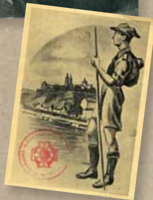
Na zdj.: Harcerze z różnych regionów ok. 1920 r.

Kolejnym krokiem na drodze do pełnego zorganizowania działalności ZHP było przyjęcie statutu. Jego treść opracowano podczas zjazdu NRH w styczniu 1920 r., a następnie przekazano do zatwierdzenia organom państwowym. Równocześnie trwała reorganizacja władz dzielnicowych. Proces ten utrudniały walki o granice oraz administracyjne problemy związane z przekazaniem władzy przez dotychczasowych przedstawicieli dawnych struktur organizacyjnych w poszczególnych zaborach. Dla przykładu - Związkowe Naczelnictwo Skautowe we Lwowie zwołuje swój ostatni zjazd na 31 marca 1920 r., przekazując zwierzchnictwo nad jednostkami harcerskimi Naczelnictwu ZHP i tworząc oddziały lwowski i krakowski Związku.