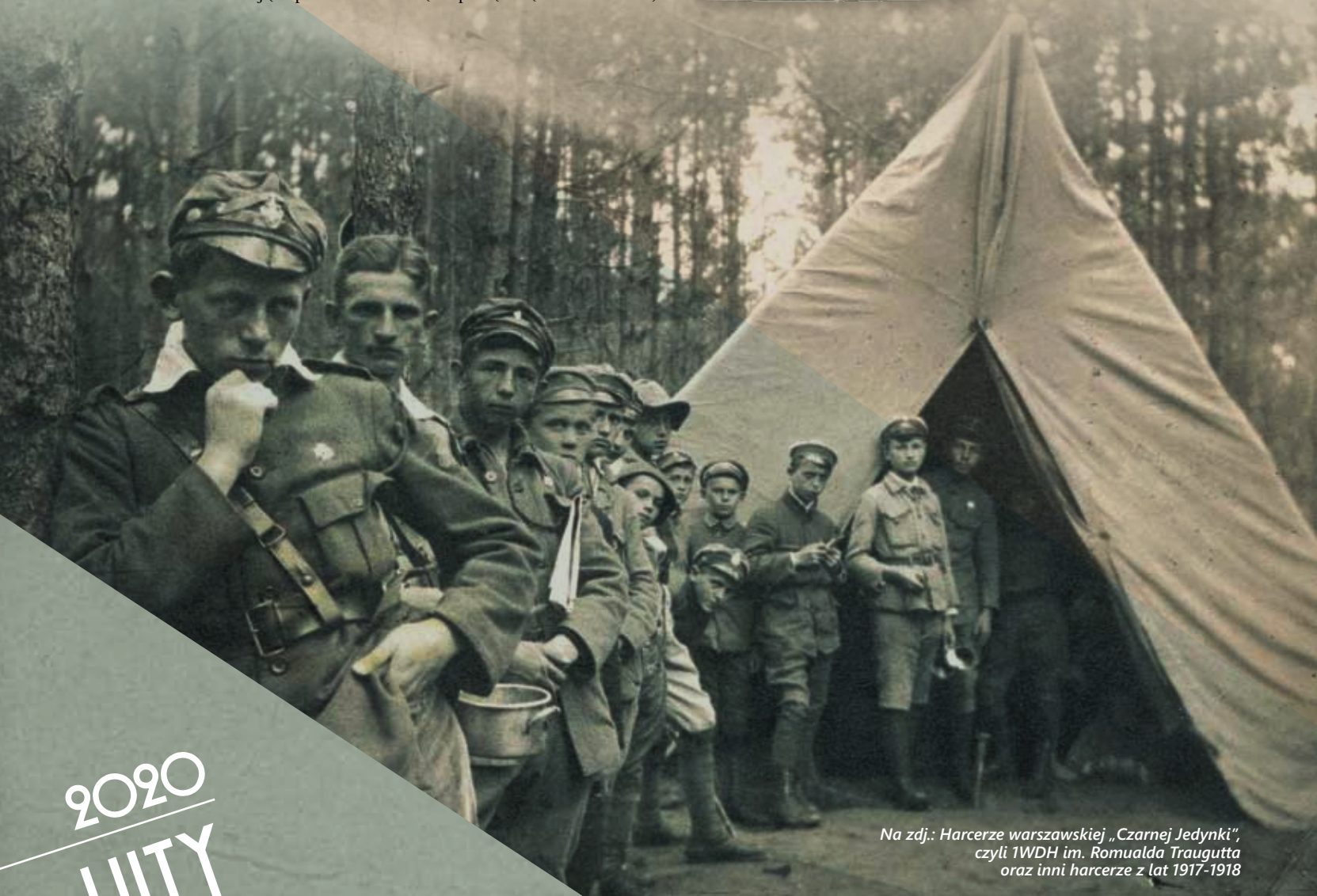
Na zdj.: Harcerze warszawskiej „Czarnej Jedyнки”, czyli 1WDH im. Romualda Traugutta oraz inni harcerze z lat 1917-1918